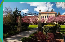
Southern Oregon Univ.