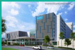
KDU Univ. College