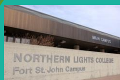
Northern Lights College