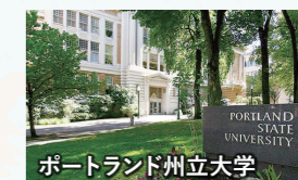
ポートランド州立大学

ポートランドの中心部に位置するオレゴン州最大の州立大学。街と自然がバランス良く共存した環境で、アメリカ文化を体感することができます。