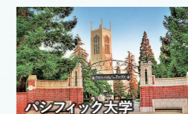
パシフィック大学

オレゴン州の南部アッシュランドに位置する総合大学。年間を通して温暖な気候で、豊かな自然に囲まれた治安の良い環境です。各国から留学生が集まる、国際色豊かな大学です。