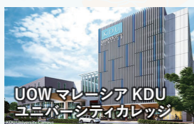
UOW マレーシア KDU ユニバーシティカレッジ

クアラルンプール郊外に位置するマレーシアでも歴史ある私立大学の一つ。キャンパス内には最新設備を備え、学生の学びを最大限にサポートしています。