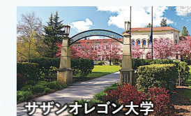
サザンオレゴン大学

ポートランドの中心部に位置するオレゴン州最大の州立大学。街と自然がバランス良く共存した環境で、アメリカ文化を体感することができます。