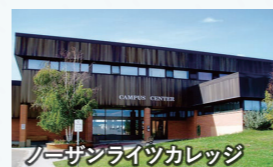
ブーサンライツカレッジ

オーロラが観測できる自然豊かな場所に位置します。授業は少人数で開講され、ESL*上級者は正規の授業を並行して受講可能。大自然が広がり、のびのびと勉強に打ち込める環境です。 *English as a Second Language