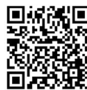
泉ヶ丘駅commons パンフレット

※演習・実践活動・発表等については、対面での参加を原則とします。実践活動の内容により、地域施設や協力団体等で実施する場合があります。